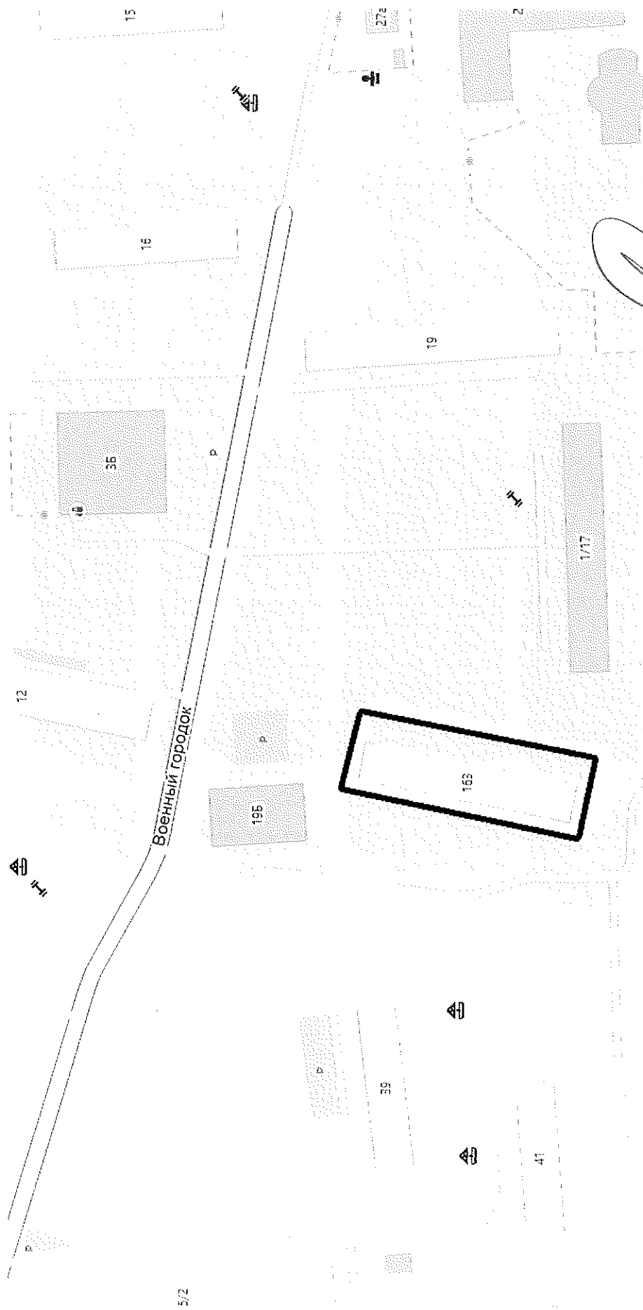
Схема границ территории деятельности территориального общественного самоуправления (ТОС) «Военный городок, 163» города Липецка