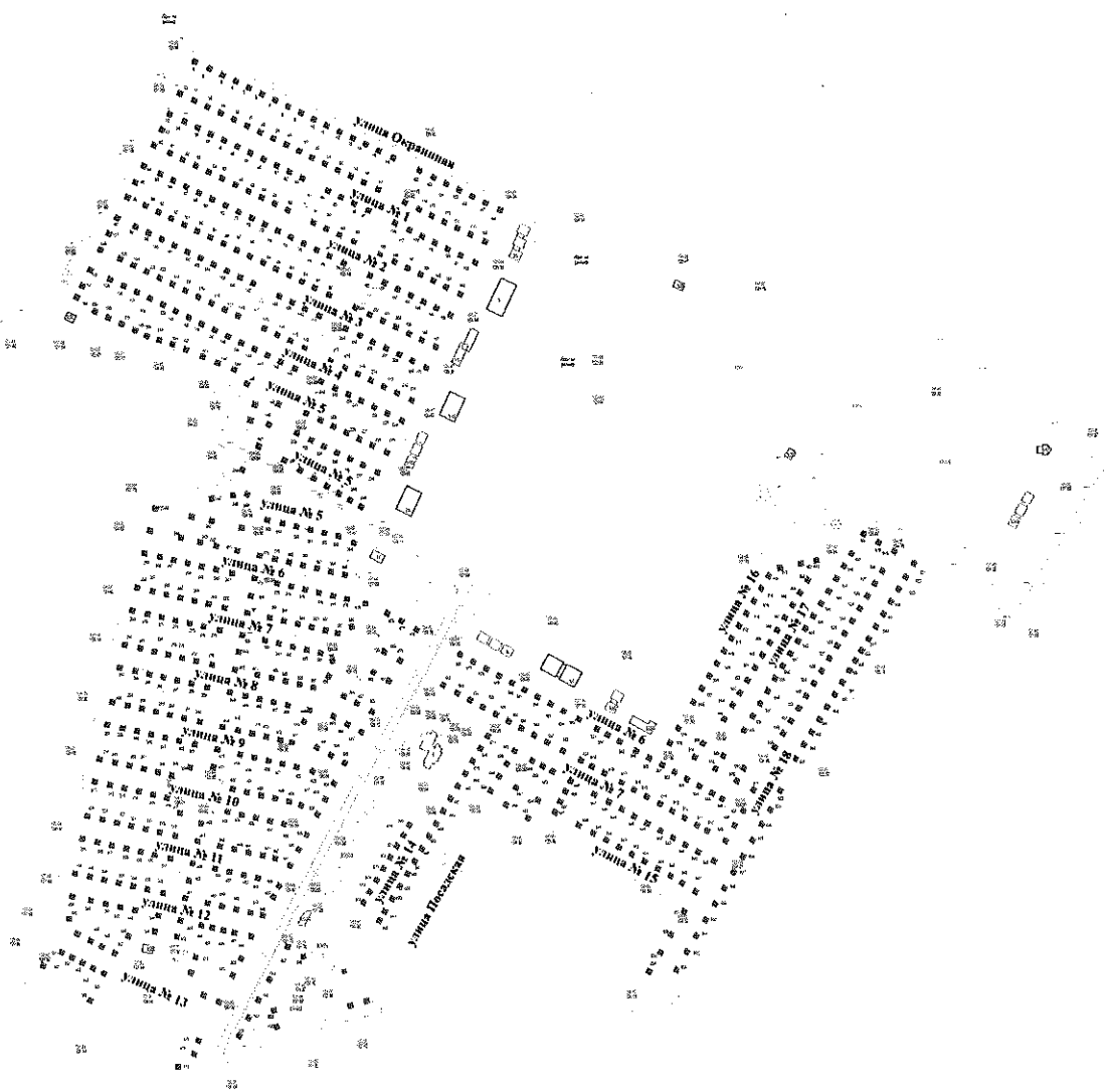
Схема расположения 18 новых улиц в индивидуальной жилой застройке для многодетных семей в районе улиц Окраинной и Посадской Правобережного округа города Липецка