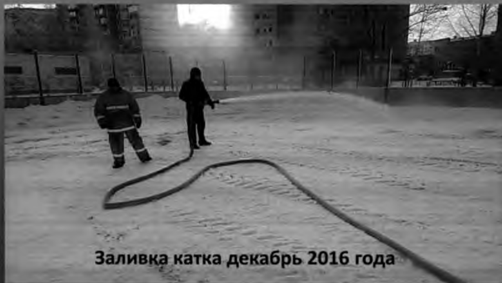
Заливка катка декабрь 2016 года