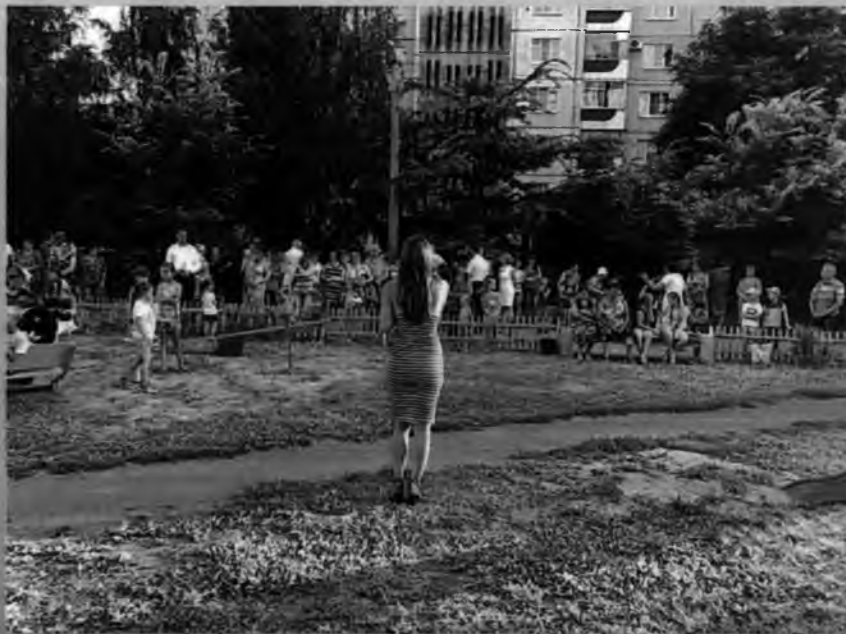
праздник к Дню города и Дню металлургов 2016