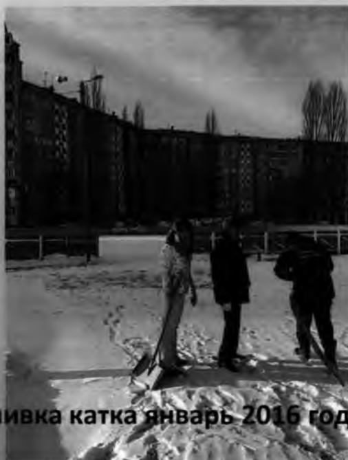
Заливка катка январь 2016 года