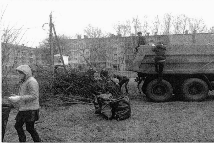
Весенняя уборка парковой зоны.