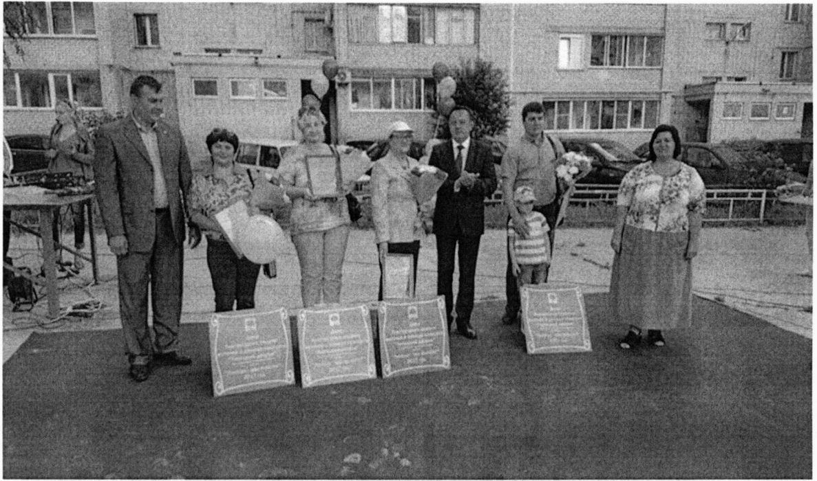
Праздник на ул. Бородинской «Липецкий дворик»