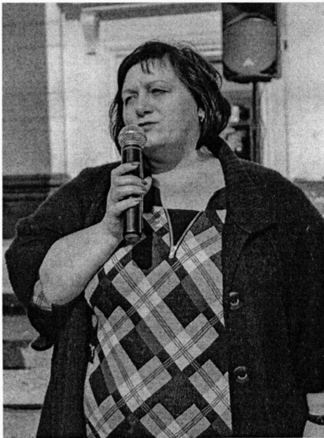
День жилого района «Сокол» (май, 2017)