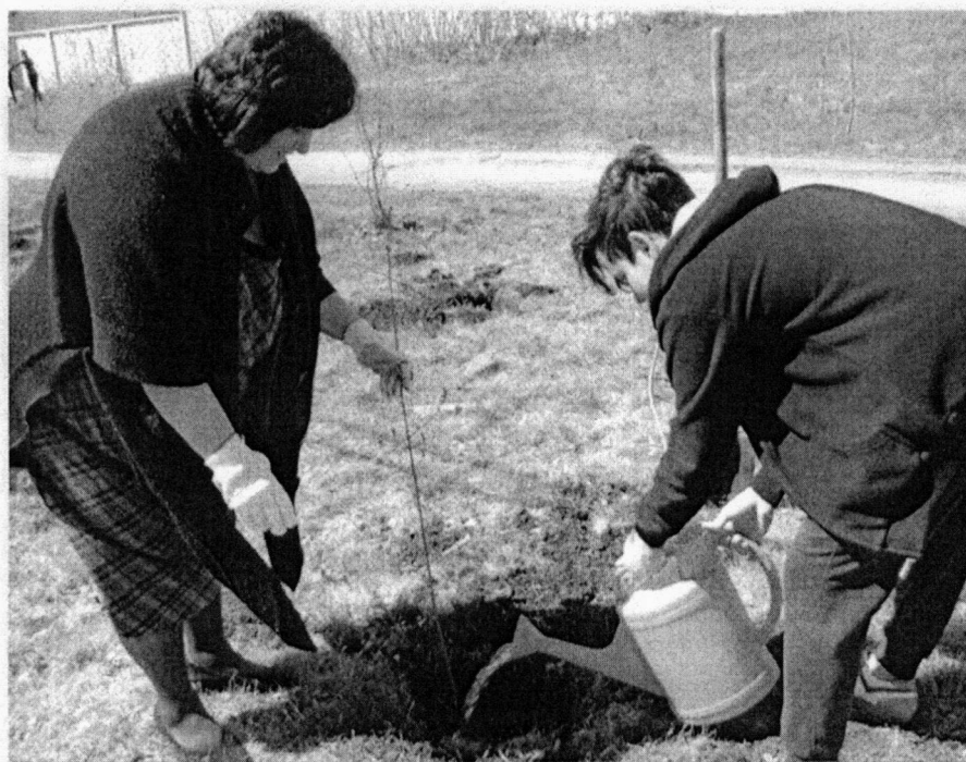
Посадка деревьев в парке (апрель, 2017)