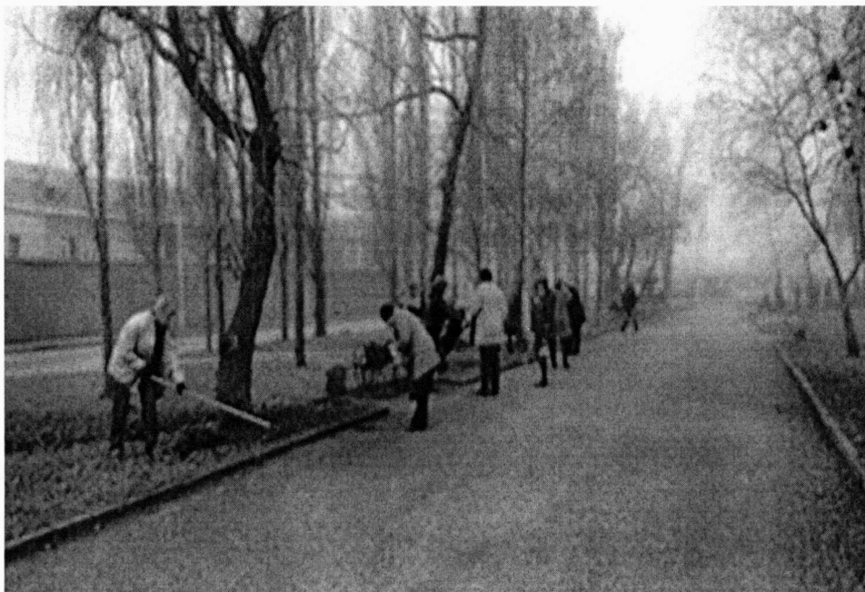
Организация субботника в сквере (апрель, 2017 г.)