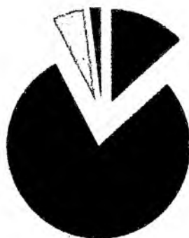
Количество вопросов, рассмотренных на заседании постоянной комиссии, из них внесено:

Проведено 12 заседаний, из них 1 стационарное совместное. В общей сложности на заседаниях рассмотрено 52 вопроса. 3 решения постоянной комиссии поставлено на «контроль». Заседания постоянной комиссии проводились согласно графику. 4 вопроса вынесено на рассмотрение сессии. Более подробно отчетные показатели о некоторых результатах работы постоянной комиссии представлены в Приложении №2 .