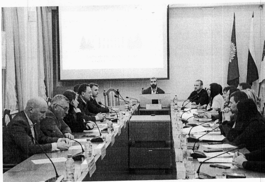
Депутаты седьмого созыва

Работа комиссии велась в полном соответствии с вопросами, которые входят в ее компетенцию.